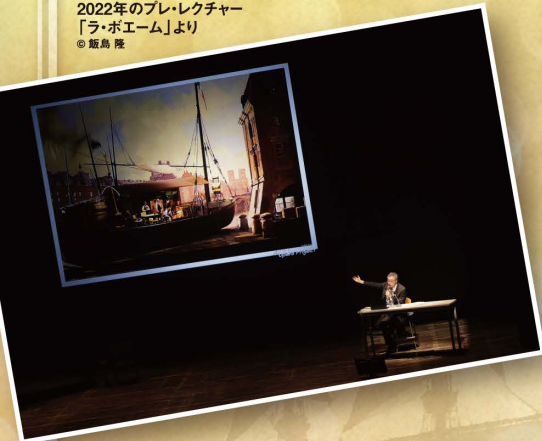
2022年のプレ・レクチャー 「ラ・ボエーム」より

この夏にお贈りする『さまよえるオランダ人』を100倍!?楽しんで頂くためのレクチャー公演。